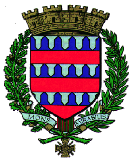
Ville de Montmirail